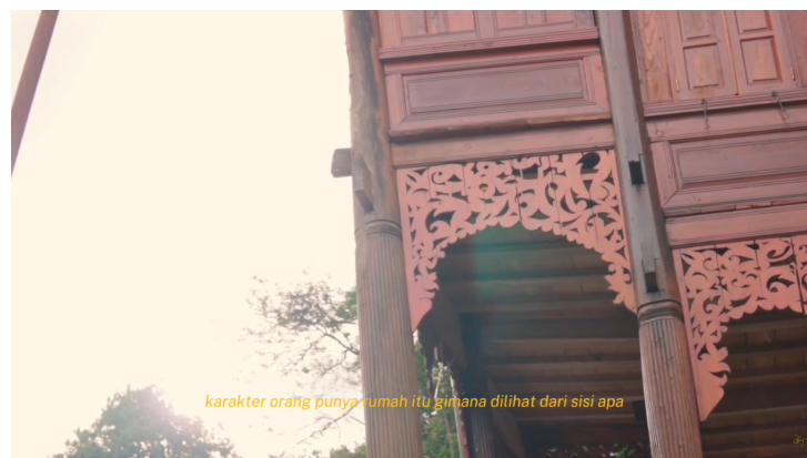
Gambar 4. Arsitektur Rumah Gadang di Nagari Sumpu

Pembahasan hasil karya menonjolkan fungsi Rumah Gadang bukan sekedar objek visual, melainkan media edukasi. Dalam video, visual diarahkan untuk memperlihatkan detail arsitektur seperti gonjong dan anjong .