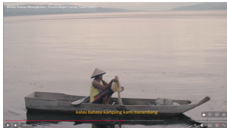
Gambar 5. Kehidupan masyarakat dengan danau

Adekan atraksi manjalo (menjala ikan) di atas sampan menjadi bagian krusial dalam pembahasan. Video secara efektif menangkap momen tradisional yang disebut masyarakat sebagai marambang .