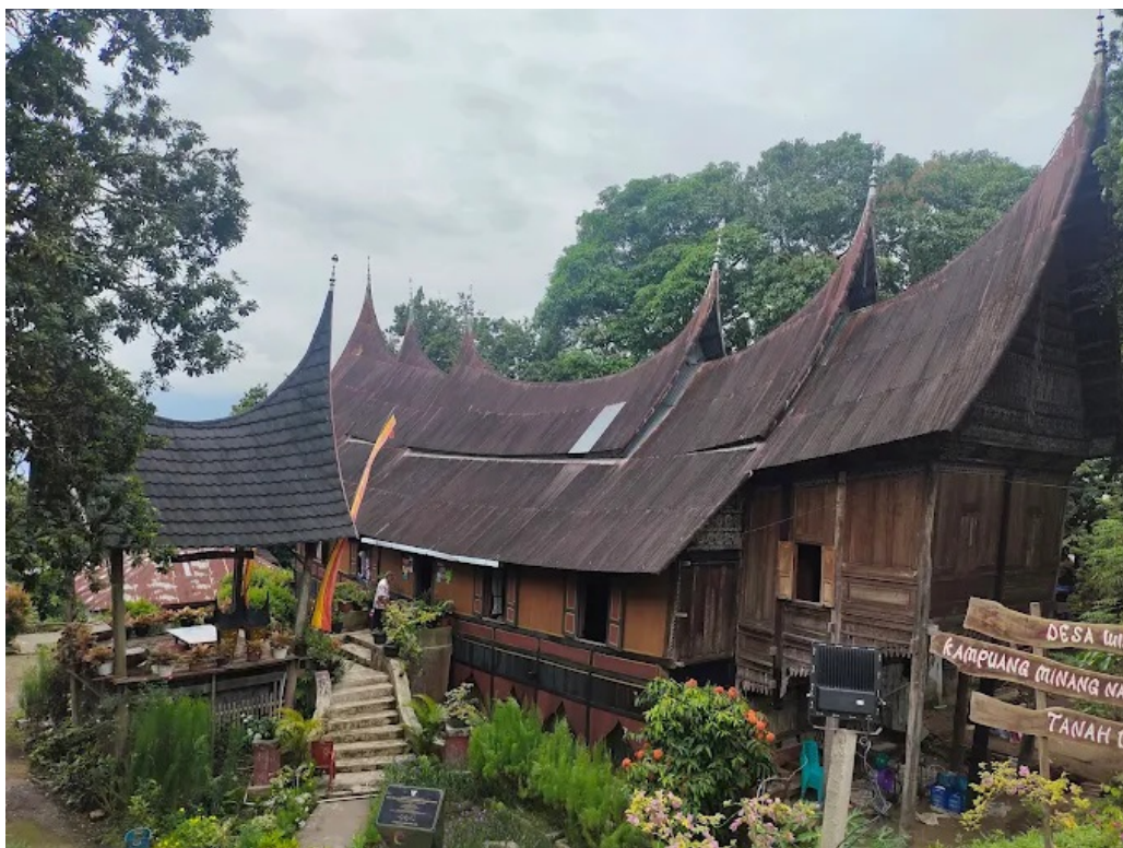
Gambar 1. Rumah Gadang di Pesona Sumpu

Pariwisata budaya merupakan salah satu sektor yang terus berkembang di Indonesia karena memiliki peran penting dalam melestarikan kearifan lokal serta mendorong pertumbuhan ekonomi masyarakat berbasis komunitas (Bida, 2025). Dalam konteks Sumatera Barat, kehadiran berbagai destinasi wisata yang mengedepankan nilai tradisi Minangkabau menjadi daya tarik tersendiri bagi wisatawan lokal maupun mancanegara (Alhamdi, 2025). Salah satu destinasi yang memiliki potensi budaya kuat namun belum mendapatkan perhatian besar adalah Kampung Minang Nagari Sumpu, sebuah desa wisata yang berada di Kecamatan Batipuah Selatan, Kabupaten Tanah Datar (Evanita, 2023). Kawasan ini dikenal masih mempertahankan kehidupan masyarakat adat, arsitektur Rumah Gadang, dan tradisi kuliner yang khas. Potensi wisata tersebut menjadikan Sumpu sebagai ruang representasi budaya Minangkabau yang autentik dan berkelanjutan.