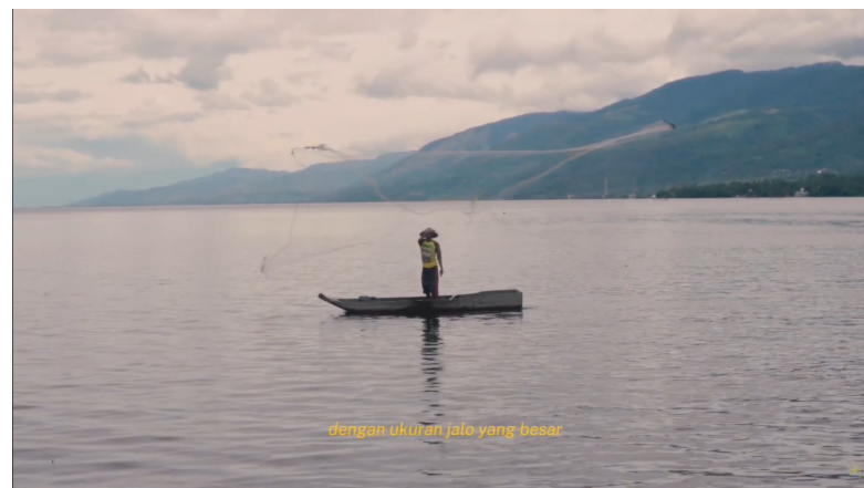
Gambar 6. Cara menangkap ikan marambang

Secara teknis, penggunaan wide shot memperlihatkan hubungan harmonis antara manusia (nelayan) dengan ekosistem Danau Singkarak. Visual ini berfungsi untuk mengkomunikasikan pesan bahwa Nagari Sumpu adalah kawasan yang masih menjaga kelestarian ikan bilih melalui cara penangkapan tradisional. Gaya pengambilan gambar yang stabil meskipun subjek berada di atas sampan yang tidak stabil menciptakan kontras visual yang menarik dan estetik