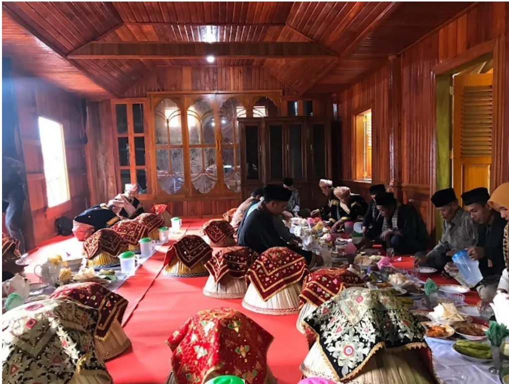
Gambar 2. Aktivitas wisata budaya makan bajamba.

makanan khas Nagari Sumpu. Bentuk aktivitas ini tidak hanya memberikan hiburan, tetapi juga pemahaman kultural bagi wisatawan mengenai nilai-nilai adat Minangkabau.