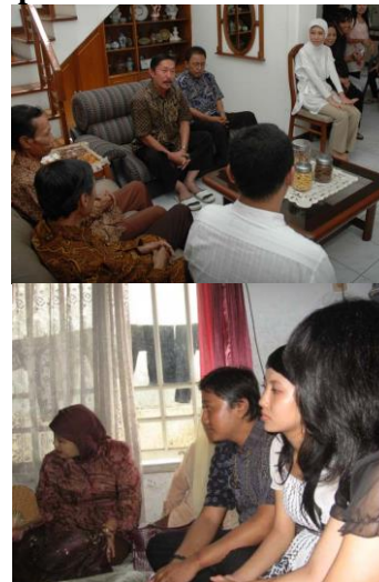
Gambar 2. Pertemuan kedua belah pihak keluarga mempelai dalam tahapan lamaran

Foto diatas membuktikan bahwa hingga kini masyarakat kota Bandung dan Ciamis masih melaksanakan salah satu tahapan dalam ritual pernikahan yakni lamaran yang berisi perbincangan antara kedua keluarga mempelai. Tahap ini dilaksanakan karena dianggap masih bermanfaat dalam persiapan kedua mempelai menuju pelaminan. Dalam tahap ini segala rencana akan diperbincangkan dengan jelas, hingga pemilihan tanggal resepsi.