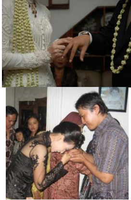
Gambar 3. Tahap tukar cincin di kota Bandung dan Ciamis

Tahap tukar cincin merupakan salah satu aktivitas dalam tahap lamaran. Dari foto diatas terlihat bahwa masyarakat kota Bandung dan Ciamis masih melaksanakan tahap tukar cincin dalam acara lamaran, cincin pada tahap ini merupakan symbol pengikat atau pameungkeut mempelai pria kepada mempelai wanita. Seiring berkembangnya budaya dan tradisi serta datangnya pengaruh budaya luar, kegiatan tukar cincin ini disebut sebagai acara tunangan, namun pada ritual asli pernikahan adat Sunda acara tunangan adalah acara tukar beubeur tameuh atau ikat pinggang berwarna pelangi dan tukar cincin adalah bagian dari acara lamaran.