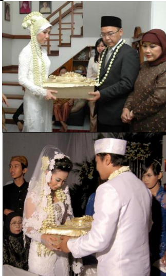
Gambar 4. Seserahan di kota Bandung dan Ciamis

Selain cincin, mempelai pria juga membawa beberapa benda diantaranya