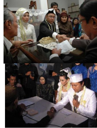
Gambar 5. Tahap Akad Nikah di Kota Bandung dan Ciamis

Tahap akad nikah yang berisi pegucapan ijab qabul merupakan tahap paling penting dalam rentetan upacara pernikahan. Begitupun di ibu kota Jawa Barat dan di kota Ciamis, tahap ini selalu dilaksanakan dalam mengikat sepasang kekasih dalam ikatan pernikahan. Setelah melalui tahap ini maka pasangan tersebut telah resmi menjadi suami istri. Pelaksanaan akad nikah di kota Bandung ada dua macam, yakni dilaksanakan dalam hari yang sama dengan resepsi dan dilaksanakan beberapa hari sebelum resepsi. Dalam ritual tradisi pernikahan adat sunda, akad nikah dan resepsi dilaksanakan dalam satu hari. Hal tersebut memperjelas bahwa sebagian masyarakat masih menganut ritual tradisi lama.