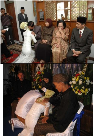
Gambar 6. Tahap sungkeman di kota Bandung dan di kota Ciamis

Di kota Bandung, setelah pengucapan ijab qabul , kedua mempelai melaksanakan tahap sungkeman dimana kedua mempelai salam kepada kedua orang tua. Sama halnya dengan di kota ciamis, tahapan ini pun dilaksanakan tepat setelah terlaksananya ijab qabul . Perbedaan pada kedua kasus ini ialah di kota Bandung, akad diadakan terpisah dengan resepsi maka sungkeman pun diadakan di hari yang berbeda dengan resepsi. Sedangkan di kota Ciamis, akad dilaksanakan satu hari dengan resepsi sehingga sungkeman pun dilaksanakan bersamaan dengan resepsi.