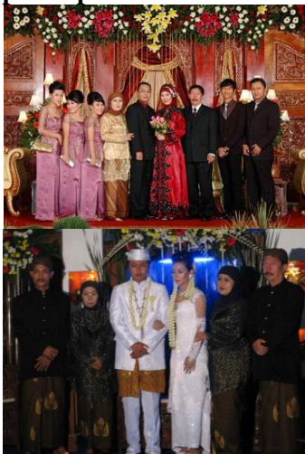
Gambar 3.7 Resepsi di kota Bandung dan di kota Ciamis

Tahap resepsi merupakan sebutan bagi tahapan setelah akad nikah, sebutan ini muncul di era modern. Di tahapan ini, kedua mempelai seharusnya melaksanakan ritual saweran , nincak endog dan muka panto , namun di kedua kota Bandung dan Ciamis, beberapa tahapan tersebut tidak dilaksanakan. Resepsi disini hanya sebagai ajang berkumpul dan pengucapan selamat dari kerabat pada pasangan pengantin baru.