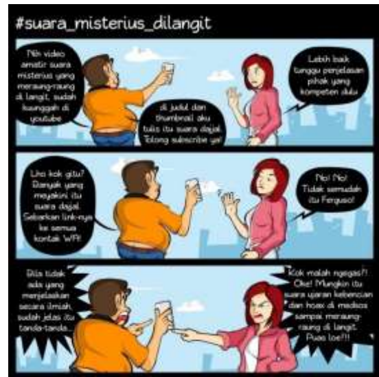
Gambar 6: Komik ke-4 Contoh kejadian nyata yang dijadikan clickbait Sumber: Saputro & Haryadi (2018)