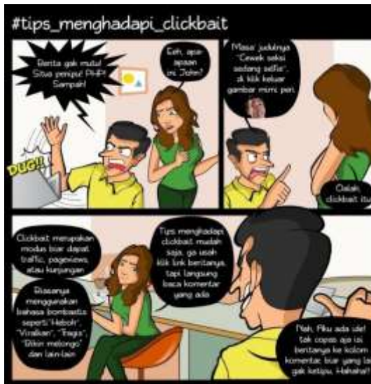
Gambar 5: Komik ke-2 Tips menghadapi clickbait