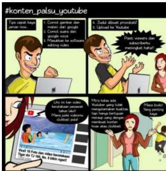
Gambar 6: Komik ke-3 Clickbait dalam bentuk video

5. Test : menguji komik strip dengan diupload di sosial media (facebook)