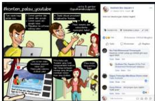
Gambar 9: Upload komik ke-3, 419 kali dibagikan, 144 like, dan 35 komentar.