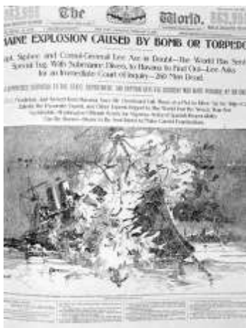
Gambar 1. Contoh berita clickbait

dimiliki Pulitzer dan Rudolph memuat judul provokatif dan bermuara clickbait . Inti dari judul tersebut bernada provokatif yang menyebutkan bahwa ledakan diakibatkan oleh serangan Spanyol, dimana hal ini dilakukan semata-mata dengan tujuan menarik pembaca untuk membeli Koran mereka. Berita koran tersebut akhirnya menjadi pemicu perang antara Spanyol dan Amerika, walau faktanya ledakan berasal dari dalam kapal sendiri dan bukan dari serangan luar.