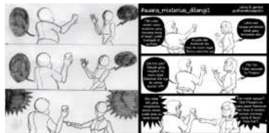
Gambar 3: Sketsa, inking, dan tata letak.