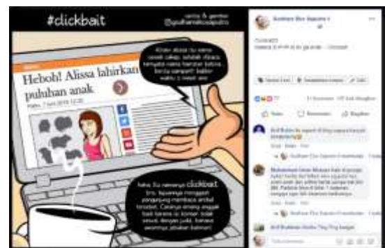
Gambar 7: Upload komik ke-1, 137 kali dibagikan, 77 like, dan 11 komentar

5. Test : menguji komik strip dengan diupload di sosial media (facebook)