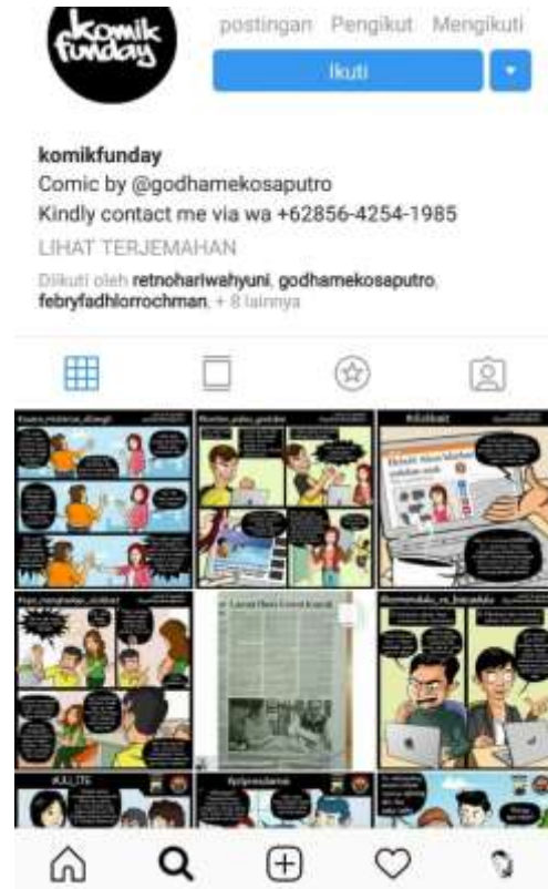
Gambar 11: Fanspage komik di instagram