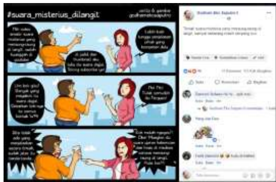
Gambar 10: Upload komik 4, 113 kali dibagikan, 96 like, dan 11 komentar.