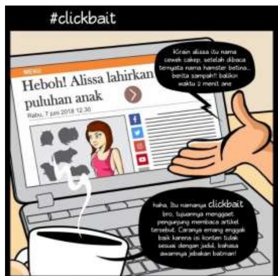
Gambar 4: Komik ke-1 berita clickbait