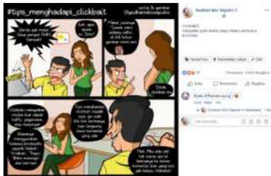
Gambar 7: Upload komik ke-2, 4 kali dibagikan, 38 like, dan 2 komentar