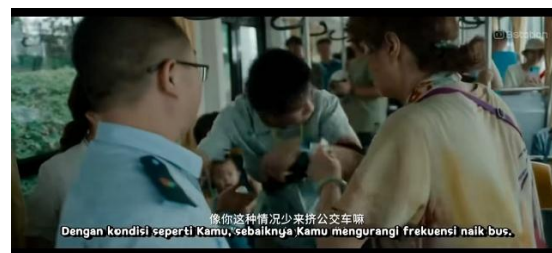
Gambar 9. Terjatuh di bus