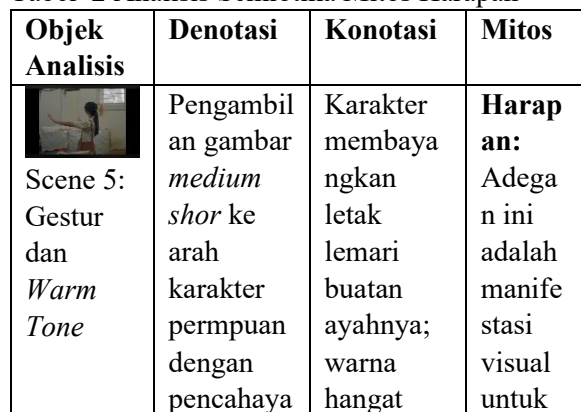
Tabel 2 Analisis Semiotika Mitos Harapan

Bagian ini menganalisis bagaimana elemen visual dan narasi "harapan" digunakan sebagai instrumen untuk mengalihkan perhatian dari kegagalan struktural terkait kepemilikan lahan di Indonesia melalui konstruksi harmoni buatan media.