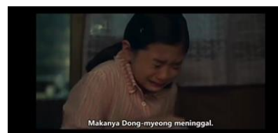
Gambar 2. Karakteristik Tanggung jawab berlebih

Pada tokoh Yang Geum-myeong direpresentasikan melalui sejumlah scene yang memperlihatkan konsistensi perannya sebagai anak perempuan sulung yang memikul beban keluarga.