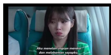
Gambar 3. Karakteristik kesulitan dalam menetapkan batas emosional

dirinya dan orang tua menjadi tidak jelas. Scene 10 saat Geum-myeong membeli seluruh dagangan nenek penjual kacang dan scene 11 saat Geum-myeong menuruti keinginan ibunya untuk dirinya berkuliah dijepang, menunjukkan kecenderungan Geum-myeong untuk selalu mendahulukan kepentingan orang lain serta menerima pengorbanan keluarga tanpa mengungkapkan kebutuhan atau keberatan pribadi. Hal ini mencerminkan kesulitan dalam menetapkan batas dalam relasi sosial maupun keluarga.