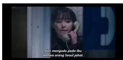
Gambar 4. Karakteristik Kecenderungan mengabaikan diri

Karakteristik ketiga yakni, Kecenderungan mengabaikan diri, yakni menempatkan kebutuhan keluarga di atas kepentingan pribadi karena internalisasi peran pengasuh sejak dini. Kecenderungan mengabaikan diri pada tokoh Yang Geum-myeong ditunjukkan melalui berbagai scene yang memperlihatkan pola penekanan kebutuhan emosional, fisik, dan psikologis demi kepentingan orang lain. Pada scene 1, Geum-myeong mengingat pengalaman masa kecil yang sulit tanpa Pembelian sepatu dalam jumlah banyak dapat dipahami sebagai bentuk kompensasi psikologis atas kebutuhan yang dahulu tidak dapat ia penuhi, menandakan proses penyesuaian diri yang mengabaikan kebutuhan pemulihan pribadi. Scene 4 saat Geum-myeong mengurungkan niat untuk mengadu kepada ibunya bahwa dia telah difitnah majikannya, dan scene 5 saat Geum-myeong memilih untuk tidak memberitahu orang tuanya bahwa dia telah difitnah, memperlihatkan bagaimana Geum-myeong memilih diam dan tidak memperjuangkan keadilan atas perlakuan tidak adil yang dialaminya, sebagai bentuk pengorbanan diri demi menjaga ketenangan lingkungan sosial.