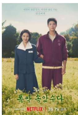
Gambar 1. Drama Korea When Life Gives You Tangerines

Drama Korea When Life Gives You Tangerines tayang di Netflix pada 7 Maret 2025. Disutradarai oleh Kim Won-seok dan ditulis oleh Lim Sang-choon, serial ini menjanjikan cerita penuh emosi dan visual yang memanjakan mata. Dengan total 16 episode. Drama ini memperoleh total delapan nominasi di 61st Baeksang Arts Awards tahun 2025. Dari nominasi tersebut, drama ini memenangkan empat penghargaan besar : Drama Terbaik untuk kategori acara televisi/drama, Aktor Pendukung Terbaik untuk peran yang dibawakan oleh Choi Dae hoon, Aktris Pendukung Terbaik untuk peran yang dibawakan oleh Yeom Hye ran. Di ajang Seoul International Drama Awards (2025), drama ini memenangkan kategori Outstanding Korean Drama dan pemeran utamanya IU memenangkan kategori Outstanding Korean Actress, Dalam enam nominasi Di ajang 4th Blue Dragon Series Awards (2025), drama When Life Gives You Tangerines meraih kemenangan di beberapa kategori yakni Grand Prize (Daesang), Best Actress: IU, Best Supporting Actress: Yeom Hye ran.