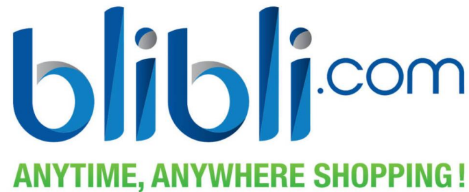
Gambar1.1: logo lama Blibli.com