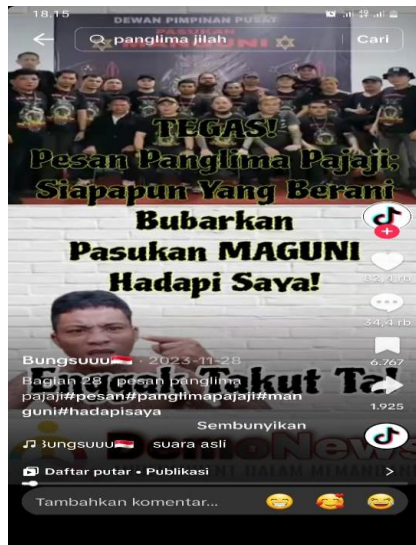
Gambar 6 dan 7, Tangkapan layar bernarasi ujaran kebencian dari akun Tiktok @ErChannel dan @Bungsu.

Konten-konten dari tokoh berpengaruh ini sering kali memicu respons emosional dari pengikutnya, sehingga semakin banyak yang membagikan ulang informasi tanpa memverifikasi kebenarannya terlebih dahulu.