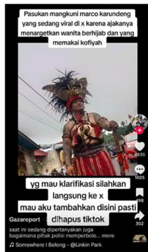
Gambar 9,10: Tangkapan layar bernarasi ujaran kebencian dari beberapa akun Tiktok

Sebaran ujaran kebencian pada konflik ini menunjukkan adanya reaksi yang begitu cepat direspon oleh sejumlah pihak yang jauh dari pusran konflik dengan mudahnya tersulut. Mereka mengatasnamakan agama yang datang dari luar wilayah Bitung, seperti Makassar, Jakarta, dan Balikpapan.