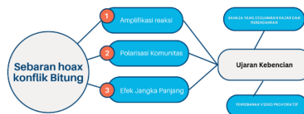
Gambar 03. Pola sebaran dan produksi ujaran kebencian pasca bentrokan massa di Bitung 2023