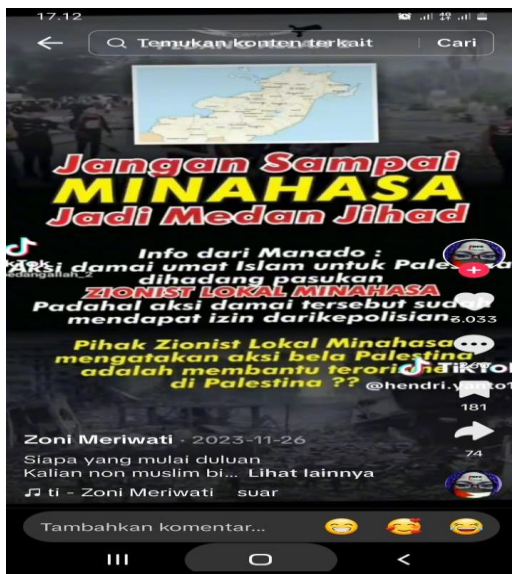
Gambar 5, Tangkapan layar bernarasi ujaran kebencian dari akun Tiktok @zoni meriwati.

Beberapa pesan dengan tensi mengancam disertai penyebutan nama etnis dan agama marak. Salah satunya nampak pada gambar tangkapan layar yang beredar di Tiktok di bawah ini. Menariknya content tersebut pengucapan narasinya menggunakan teknologi IA berupa suara rekaman berbasis non-human (robotic) .