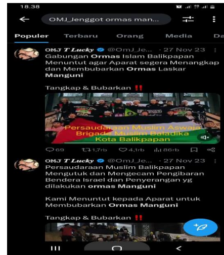
Gambar 8, Tangkapan layar bernarasi ujaran kebencian mengatasnamakan umat Islam Balikpapan dari akun X @omj. T Lucky

Sementara itu, @Zero Failed dari Aliansi Pembela Islam Makassar menegaskan sikap.