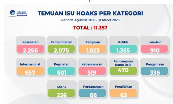
Gambar 1, Data temuan hoax dalam berbagai kategori dari 2018-2023