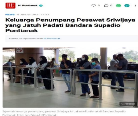
Gambar 3. Contoh berita Hi! Pontianak yang Memuat Nilai Berita Kebaruan

Hi!Pontianak - Pesawat Sriwijaya Air dengan kode SJ-182 yang terbang dari Jakarta menuju Pontianak hilang kontak, Sabtu, 9 Januari 2021.