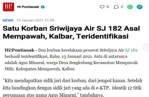
Gambar 6. Isi Berita Memuat Figur Agus Minarni