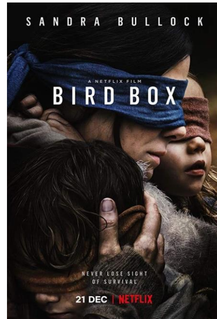
Gambar 1 Poster Film Bird Box

Terdapat dua prinsip desain poster, pertama adalah keserasian. Keserasian adalah skema dari formasi untuk menghindari adanya tumpang tindih dalam poster. Jika melihat poster film 'Bird Box', walaupun objek (ibu dan kedua anaknya) melihat kesamping (arah samping poster) dan tidak melihat kearah depan (permukaan poster), namun elemen-elemen tersebut membuat kesan poster menjadi berisi dan tidak kosong, sehingga menciptakan visual yang menarik dilihat. Prinsip desain poster yang kedua adalah alur baca, alur baca ini diciptakan dengan sistematis guna membimbing fokus yang melihat dan mendalami berita yang ada, dimulai sisi yang satu ke sisi yang lain. Seperti visualisasi 'Bird Box' yang jika dilihat secara saksama, banyak sekali detail-detail yang menarik.