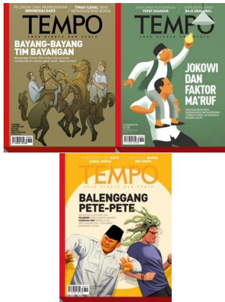
Gambar Majalah Terkait Pemberitaan Kampanye 2019

Sebagai contoh majalah Tempo edisi 26 Oktober 2018 yang membahas bayang–bayang tim bayangan, majalah Tempo edisi 15 desember 2018 yang membahas Jokowi dan Faktor Ma’aruf Amin dan majalah Tempo edisi 21 Desember Balenggang Pete – Pete.