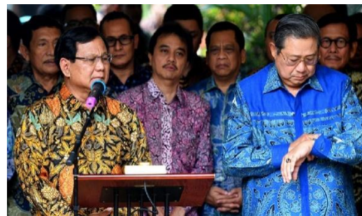
Gambar: Foto Jurnalistik Prabowo Subianto Dalam Berita “Balik Kanan Sebelum Kiamat” Majalah Tempo Edisi 19 - 25 November 2018 Halaman 34