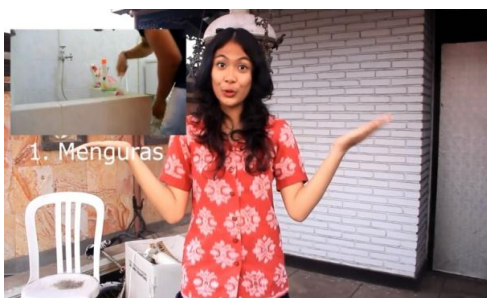
Cuplikan; gambar 6.

teks narasi yang dibawakan, “Lakukan pencegahan dengan 3M +”. Penanda ( signifier ) Pencegahan - 3M+ sebagai Petanda ( signified ) bermakna konotasi ‘metode / terobosan / langkah-langkah / strategi’ sehingga dianggap sebagai strategi efektif dalam upaya pencegahan. Makna dari tanda pertama dan tanda kedua (teks narasi) memiliki hubungan konotasi yaitu istilah 3M+ dianggap sebagai tiga langkah plus atau strategi efektif dalam upaya pencegahan DBD. Menurut Roland Barthes, ideologi berfungsi terutama pada level konotasi, makna sekunder, makna yang sering kali tidak disadari, yang ditampilkan oleh teks dan praktik, atau yang bisa ditampilkan oleh apa pun (Storey, 2003: 8). Sehingga ideologi yang dibangun atau muncul pada cuplikan tayangan kelima adalah 3M+ yaitu tiga langkah plus yang wajib dilakukan sebagai upaya pencegahan DBD. Konotasi inilah yang berkembang sebagai asumsi umum di masyarakat.