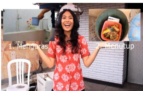
Cuplikan; gambar 7.