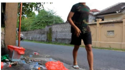
Cuplikan; gambar 2 a.

semiotik pada cuplikan tayangan iklan tersebut. Pertama, penanda ( signifier ) rumah (latar) dengan kardus, sepeda, terlihat berantakan,- dan konsep rumah sebagai petanda ( signified ). Menurut Barthes (1998), hubungan antara penanda dan petanda ( signifier-signified ) menentukan makna dari tanda. Sehingga makna yang ditampilkan pertama adalah sebuah rumah yang kurang bersih dan rapi. Konsep makna pertama akan mendukung pemaknaan kedua; yaitu dari teks narasi yang dibawakan, “ Kita tidak pernah tahu kapan penyakit menghampiri kita ”.... Penanda ( signifier ) penyakit yang dikhiaskan secara metaporis ‘ menghampiri ’ Petanda ( signified ) bermakna konotasi musibah atau bencana bahwa penyakit tertentu ‘ tidak terprediksi ’ atau ‘ tanpa diundang ’ mendatangi. Makna dari tanda pertama (latar rumah) dan tanda kedua (teks narasi) memiliki hubungan konotasi yaitu rumah yang kurang rapi dan bersih akan membuat suatu penyakit menghampiri penghuni rumah kapan saja. Menurut Roland Barthes. Ideologi berfungsi terutama pada level konotasi, makna sekunder, makna yang sering kali tidak disadari, yang ditampilkan oleh teks dan praktik, atau yang bisa ditampilkan oleh apa pun (Storey, 2003: 8). Sehingga ideologi yang dibangun atau muncul pada cuplikan pertama adalah sebuah citra ‘rumah yang kurang rapi dan bersih dianggap tempat berkembangnya penyakit. Ideologi seperti ini masih berkembang di masyarakat.