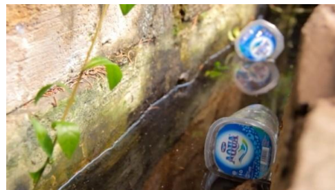
Cuplikan; gambar 2.b

Narasi: “ Terkadang perilaku yang kita lakukan berdampak buruk terhadap kesehatan kita ”