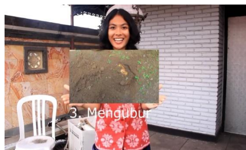
Cuplikan; gambar 8.

memiliki hubungan konotasi yaitu istilah Menutup (3M+) dianggap sebagai langkah kedua dari tiga langkah plus atau strategi efektif dalam upaya pencegahan DBD. Menurut Roland Barthes, ideologi berfungsi terutama pada level konotasi, makna sekunder, makna yang sering kali tidak disadari, yang ditampilkan oleh teks dan praktik, atau yang bisa ditampilkan oleh apa pun (Storey, 2003: 8). Sehingga ideologi yang dibangun atau muncul pada cuplikan tayangan keenam adalah langkah Menutup (3M+). Tempat sampah ( insert ) memiliki mitos sebagai ‘sarang nyamuk’ karena dianggap tempat berkumpulnya nyamuk, sehingga ‘menutup’ dalam konotasi menutup tempat-tempat penampungan sampah, air, muncul sebagai mitos yang mantap, dan kemudian menjadi ideologi khusus di masyarakat. Namun, dalam cuplikan tayangan ( insert gambar), secara jelas tidak berindikasi langkah atau aksi ‘menutup’ tempat sampah; sehingga aspek ideologi di balik pesan verbal kurang bersifat persuasif.