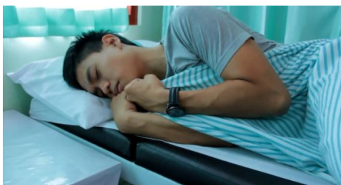
Cuplikan; gambar 3

Menurut Roland Barthes, ideologi berfungsi terutama pada level konotasi, makna sekunder, makna yang sering kali tidak disadari, yang ditampilkan oleh teks dan praktik, atau yang bisa ditampilkan oleh apapun (Storey, 2003: 8). Sehingga ideologi yang dibangun atau muncul pada cuplikan (gambar 2a, 2b) adalah sebuah citra 'perilaku mencemari lingkungan berdampak negatif bagi kesehatan masyarakat di sekitarnya'.