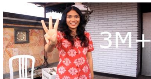
Cuplikan; gambar 5.

demam tinggi. Menurut Roland Barthes, ideologi berfungsi terutama pada level konotasi, makna sekunder, makna yang sering kali tidak disadari, yang ditampilkan oleh teks dan praktik, atau yang bisa ditampilkan oleh apa pun (Storey, 2003: 8). Sehingga ideologi yang dibangun atau muncul pada cuplikan keempat adalah gejala DBD demam tinggi hari pertama berkonotasi ‘darurat’. Ideologi seperti ini masih menjadi asumsi umum di masyarakat.