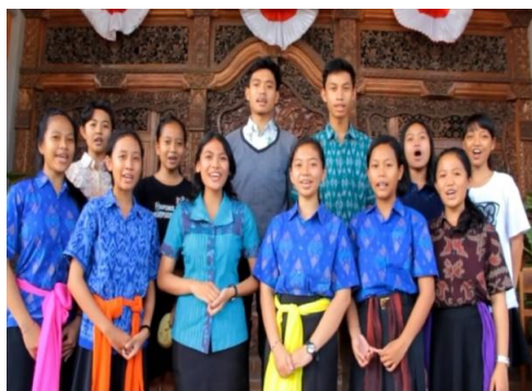
IKLAN LAYANAN MASYARAKAT INI DIPERSEMBAHKAN OLEH

pengecanaan. Makna dari tanda pertama dan tanda kedua (teks narasi) memiliki hubungan konotasi yaitu Hindari gigitan nyamuk dengan cara memakai lotion anti nyamuk dianggap sebagai langkah plus dari tiga langkah plus atau strategi efektif dalam upaya pencegahan DBD. Menurut Roland Barthes, ideologi berfungsi terutama pada level konotasi, makna sekunder, makna yang sering kali tidak disadari, yang ditampilkan oleh teks dan praktik, atau yang bisa ditampilkan oleh apa pun (Storey, 2003: 8). Sehingga ideologi yang dibangun atau muncul pada cuplikan tayangan kesembilan adalah langkah Menghindari gigitan nyamuk (3M+). Lotion tertentu ( insert ) memiliki mitos sebagai ‘anti nyamuk’ karena dianggap ampuh menjauhkan nyamuk, sehingga ‘lotion’ dalam konotasi ‘anti nyamuk’ muncul sebagai mitos yang mantap, dan kemudian menjadi ideologi khusus di masyarakat. Namun, dalam cuplikan tayangan ( insert gambar), secara jelas tidak berindikasi langkah atau aksi ‘memakai lotion anti nyamuk’; sehingga aspek ideologi di balik pesan verbal kurang bersifat persuasif.