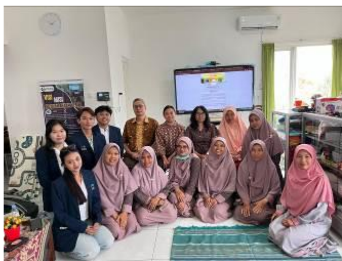
Gambar 1. Para guru dan Pelaksana Kegiatan Pengabdian kepada Masyarakat

Pendidikan anak usia dini (PAUD) mempunyai peran besar dalam menguatkan kepribadian, kecerdasan, serta keterampilan sosial anak sejak usia dini. Tahap pendidikan ini menjadi fondasi utama dalam menanamkan nilai-nilai moral, etika, dan spiritual yang akan menjadi dasar bagi perkembangan anak di masa mendatang. Sebagai upaya memenuhi kebutuhan masyarakat akan pendidikan berbasis nilai-nilai Islam, berdirilah KB Islam Anak Negeri Karangploso, Kabupaten Malang, Jawa Timur yang berkomitmen memberikan layanan pendidikan terpadu antara aspek akademik dan keislaman. Sejak berdiri pada tahun 2019, lembaga ini telah berperan aktif dalam pendidikan intelektual dengan memiliki pemahaman spiritual yang kuat.