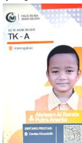
Gambar 5. Tampilan Untuk Absensi Digital Siswa