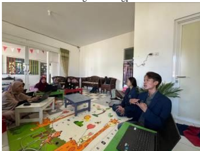
Gambar 2. Pelatihan Penggunaan TikTok untuk Promosi Sekolah