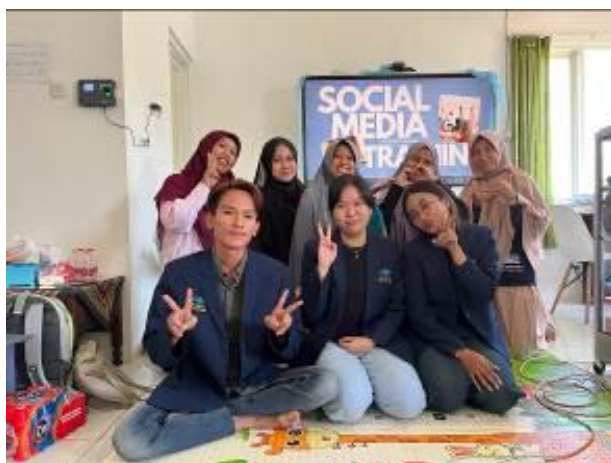
Gambar 3. Para Peserta Pelatihan Aplikasi TikTok dan Canva