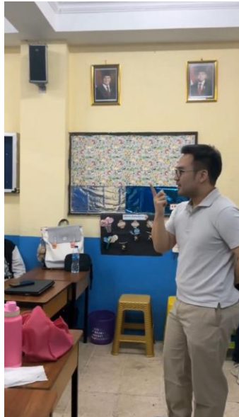
Gambar 3. Sesi Tanya Jawab dan Interaksi Peserta