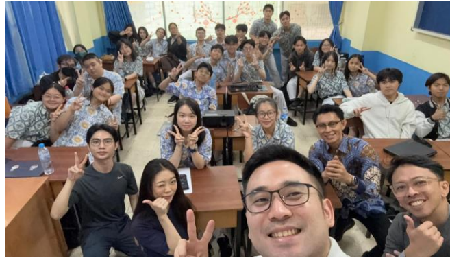
Gambar 5. Dokumentasi Bersama Peserta dan Tim PKM