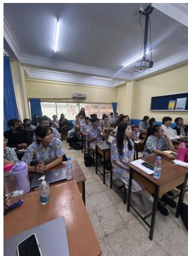
Gambar 6. Suasana Kegiatan Pelatihan Secara Keseluruhan