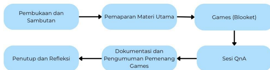
Gambar 1. Diagram Alur Tahapan Pelaksanaan Kegiatan PKM