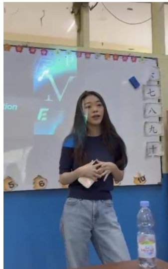
Gambar 2. Pemaparan Materi Content Writing oleh Mahasiswa Pelaksana

Sesi tanya jawab (Q&A) menjadi momen yang paling mengejutkan bagi tim pelaksana. Peserta tidak hanya mengajukan pertanyaan teknis, tetapi juga menyampaikan aspirasi mereka tentang bagaimana content writing dapat menjadi bekal karier di masa depan mulai dari menjadi content creator , copywriter , hingga membangun bisnis digital sendiri. Fenomena ini menunjukkan bahwa pelatihan content writing tidak hanya berfokus pada penyampaian pengetahuan teknis, tetapi juga memberikan ruang bagi peserta untuk mengeksplorasi konteks penerapannya; ia mampu memberikan wawasan tambahan mengenai peluang karier dan kewirausahaan digital bagi siswa SMA. Sesi games edukatif menggunakan Blooket kemudian mengkonsolidasikan pemahaman peserta dalam suasana kompetitif yang menyenangkan, menciptakan pengalaman belajar yang memorable dan engaging .