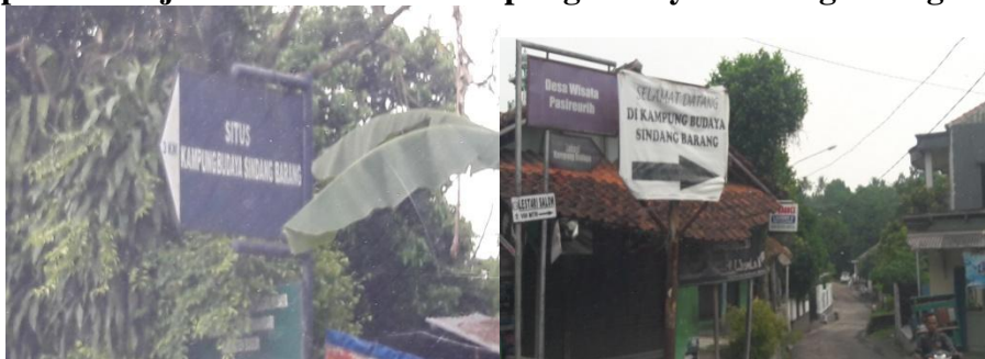
Gambar 4 Papan Penunjuk Informasi Ke Kampung Budaya Sindangbarang Bogor

Untuk papan penunjuk informasi menuju Kampung Budaya Sindangbarang sendiri memerlukan ketelitian dari pengemudi yang baru pertama kali datang, dikarenakan papan penunjuk informasi kurang besar terutama di titik menuju Gang Nurkim yang tertutup pepohonan. Jika pengunjung tidak berhati-hati atau tidak bertanya ke masyarakat sekitar, maka pengunjung bisa tersesat.