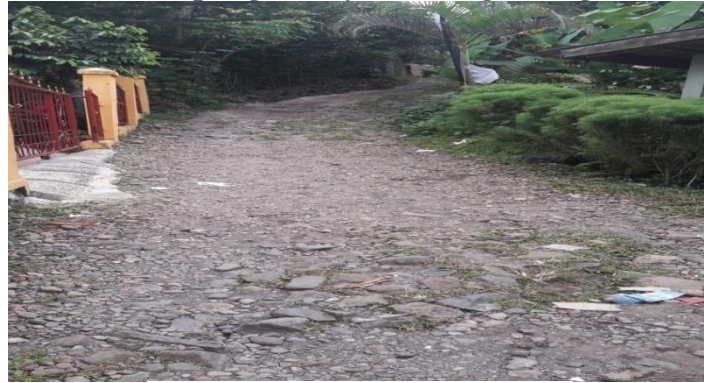
Gambar 3 Akses Jalan dari Lahan Parkir menuju Pintu Masuk Kampung Budaya Sindangbarang

masih cukup berbatu dan cukup menyulitkan untuk masuk ke lahan parkir tersebut. Untuk akses dari lahan parkir menuju pintu masuk kawasan Kampung Budaya Sindangbarang cukup menanjak dan berbatu. Hal ini karena konsep Kampung Budaya yang bersifat alami.