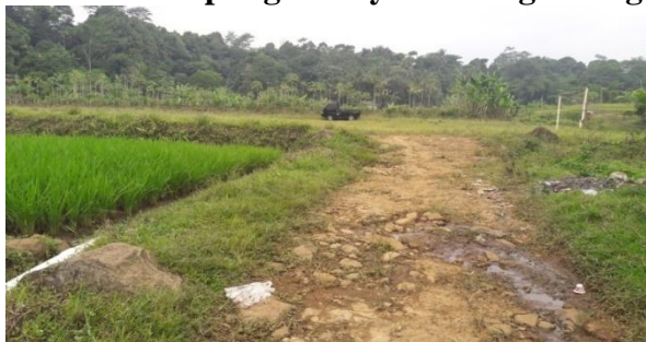
Gambar 2 Lahan Parkir Kampung Budaya Sindangbarang Bogor

Transportasi umum yang bisa digunakan pengunjung adalah dengan menggunakan moda transportasi darat. Rute dari Terminal Baranangsiang maupun Stasiun Bogor bisa menggunakan berbagai trayek angkot yang menuju Bogor Trade Mall (BTM), dilanjutkan dengan angkot 03 (Jurusan Ciapus-Ramayana) sampai ke Gang Nurkim. Lalu dilanjutkan ke kawasan utama dengan menggunakan ojek baik tradisional maupun online. Waktu tempuh dari BTM ke kawasan berkisar 30 menit jika lancar sampai dengan 1 (satu) jam jika terjadi kemacetan di beberapa titik. Jika menggunakan transportasi pribadi, maka rute yang bisa dilalui jika dari Terminal Baranangsiang adalah menuju ke BTM menuju Pancasan lalu Ciapus.