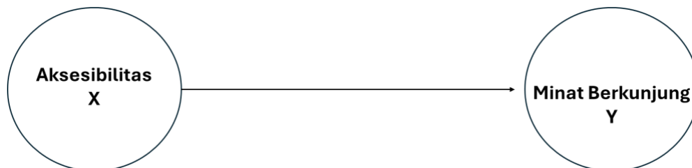
Gambar 2: Kerangka Konseptual Penelitian