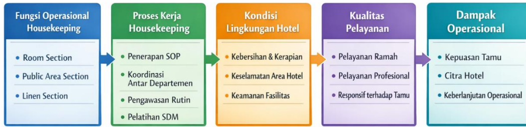
Gambar 3. Model Peran Housekeeping Department Dalam Tata Kelola Operasional Hotel

Selain kondisi internal di dalam departemen, terdapat juga kondisi lingkungan hotel yang secara optimal berkontribusi langsung terhadap kualitas pelayanan yang dirasakan oleh tamu. Kualitas operasional dari semua departemen, termasuk housekeeping, memiliki kontribusi signifikan terhadap persepsi kualitas layanan karena merupakan bagian dari sistem layanan terpadu yang mempengaruhi pengalaman pelanggan secara langsung (Ganie & Raina, 2024; Radita et al., 2022). Kualitas pelayanan ini ditunjukkan melalui pelayanan yang ramah, profesional dan responsif. Pada akhirnya kualitas pelayanan ini berpengaruh positif dan signifikan terhadap tingkat kepuasan tamu, citra hotel dan keberlanjutan operasional hotel sendiri (Belia, 2022; Rajey et al., 2025).