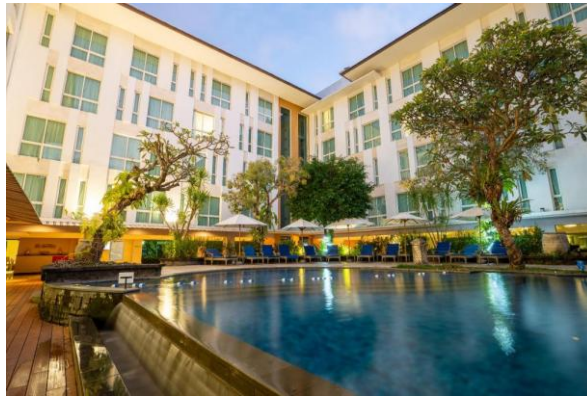
Gambar 1. Fasilitas Kolam Renang pada Bintang Kuta Hotel, Bali

Selain itu, dalam hubungannya dengan persepsi tamu, Bintang Kuta Hotel mendapatkan ulasan positif dari tamu yang sudah menginap dengan skor keseluruhan yang baik, terutama pada aspek kebersihan, kenyamanan, lokasi, dan pelayanan staf. Misalnya, pada website Agoda dan website Booking.com, hotel ini mendapatkan skor sebesar 8,6 dari 10, dengan kriteria penilaian mulai dari lokasi, harga, fasilitas hingga aspek layanan, kebersihan dan kenyamanan kamar.